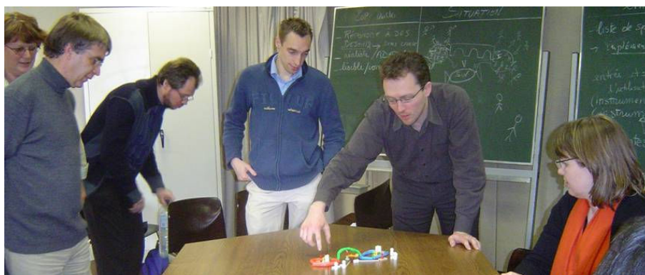
Figure II. Activité participative de simulation de la mise en œuvre d'un scénario d'activité

L'alignement des intérêts communs est recherché à chaque étape de la méthodologie et se réalise en particulier au moment des activités participatives réunissant partenaires du projet et membres des communautés tel qu'on peut le voir sur la photographie de la figure II. Il s'agit de simuler à l'aide d'un matériel concret (COMPAD) la mise en œuvre des différentes étapes d'un scénario proposé à une communauté.